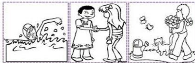
Friday Saturday Sunday