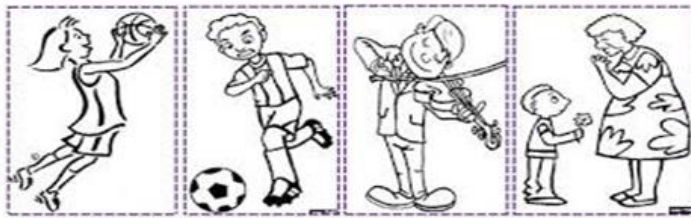
Monday Tuesday Wednesday Thursday

1- Complete with the day of the week in English according to the pictures. (Complete com os dias da semana em Inglês de acordo com as gravuras).